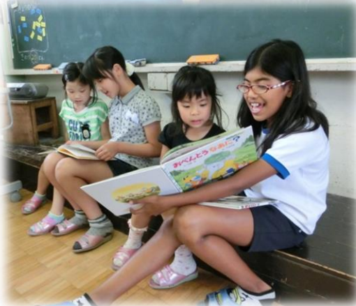
左：おはなしたんけんたい による読み聞かせ 右上：おはなしひろば 右下：ペア読書活動

平成26年度全国学力・学習状況調査 小学校調査 回答結果集計 [児童質問紙] 豊川市立東部小学校一児童