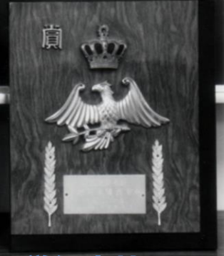
昭和41年 学校給食運営優良校