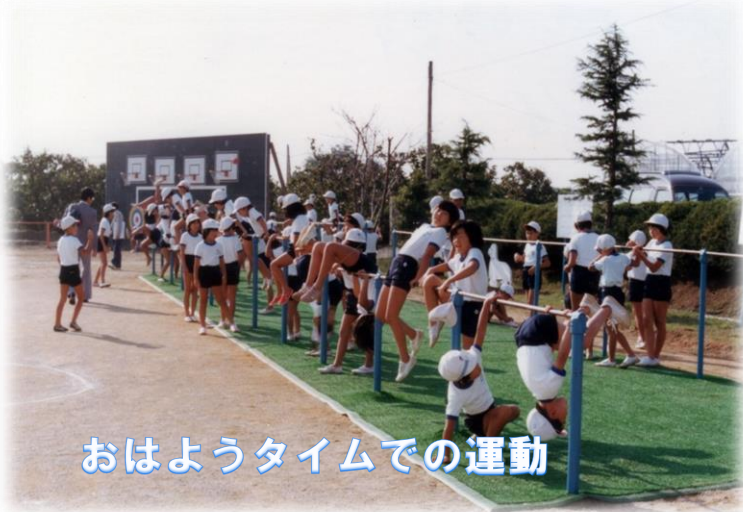
おはようタイムでの運動