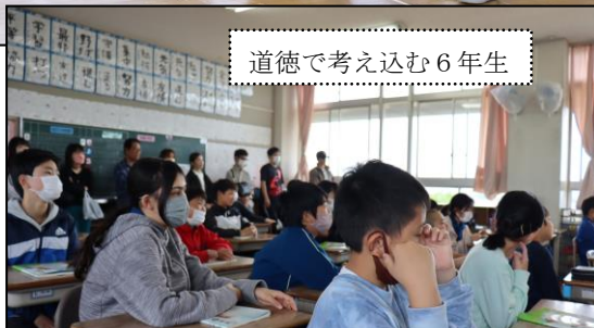
道徳で考え込む6年生