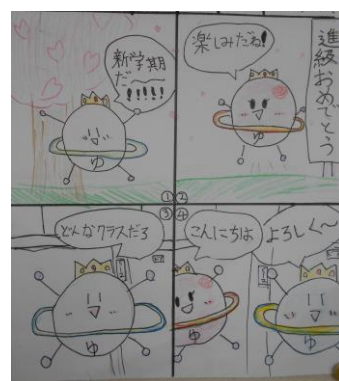
↑広報委員の手作り、ゆたか ん新聞の4コマまんが

学校携帯電話番号は、 080-7069-9610 です。この番号で着信させていただくことがありますので、ご承知おきください。なお、ふだんの連絡や問い合わせなど、ご家庭から発信する際は、 86-1001 へおかけください。