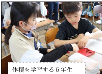
体積を学習する5年生