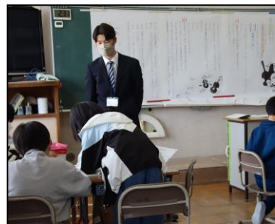
4年生、担任の指示に素早く反応。