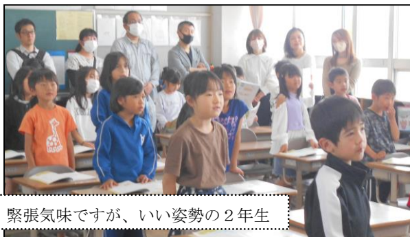
緊張気味ですが、いい姿勢の2年生

PTA 総会の各提案項目については、Web 上の票決により全て承認をいただきました。ここに報告いたします。さて、参観日、大勢の保護者の方の来校に、張り切って授業に臨んだ豊っ子です。しっかり学んでいる様子を見てもらって、きっと、どの子もうれしかったことでしょう。