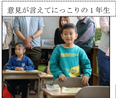
意見が言えてにっころの1年生