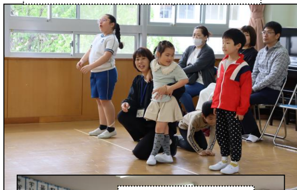
「ようこそ1年生」の会を行う4～8組。