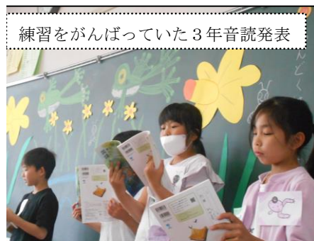
練習をがんばっていた3年音読発表

今年も素晴らしいマナーの 地域の方々に助けられて、 今後の行事を円滑にやって いけそうです。感謝いたします。