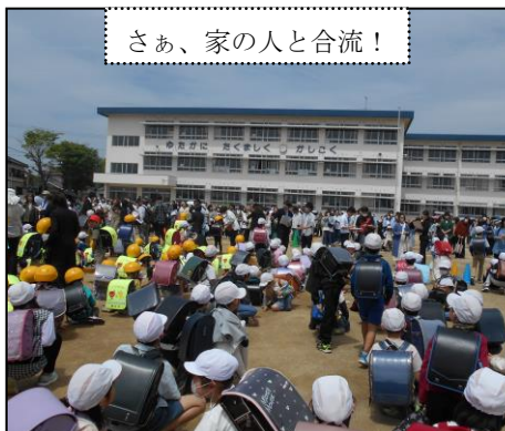
さあ、家の人と合流！