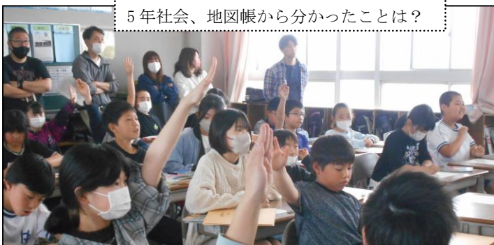
5年社会、地図帳から分かったことは？