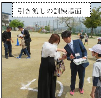
引き渡しの訓練場面