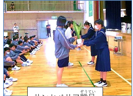
サンセベリア贈呈