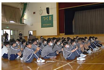
代中レンジャー登場