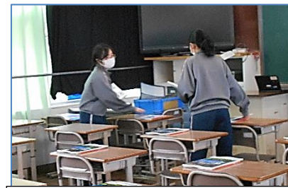
教科書等を机の上に置きます。