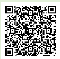
「ラーケーションの日」ポータルサイト

「ラーケーションの日」には、様々な活動ができます。どのような活動ができるのか、どうやって「ラーケーションの日」を取ればよいのかなど、興味をもった人は、おうちの方に配った「保護者用リーフレット」を見たり、右の二次元コードから、「ラーケーションポータルサイト」を見たりしながら、おうちの方と話し合ってください。