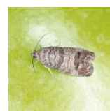
Bướm đêm Cydia pomonella