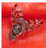
Ruồi hại quả Địa Trung Hải

*Ngoài ra, cấm đem vào Nhật Bản nhiều loại thực vật từ các quốc gia và khu vực có các loài sâu bệnh gây hại nghiêm trọng trên thế giới dù chưa phát sinh ở Nhật Bản. Để biết chi tiết, vui lòng liên hệ với trạm bảo vệ thực vật.